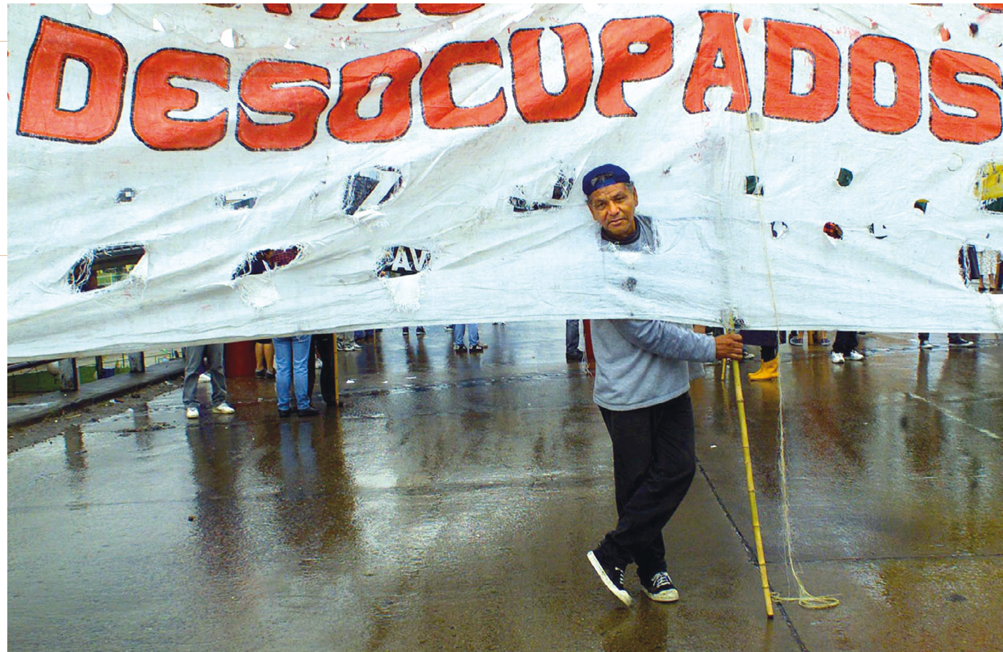
Desocupados cortan el puente Pueyrredón en el marco de un paro nacional decretado por las centrales obreras. El corte del Puente que une CABA con Avellaneda se volvió algo habitual.

Además, debido al contexto económico y financiero, el Banco profundizó políticas de recupero de deudores con el Plan de Cancelación de Deudas Bancarias con Títulos de la Deuda Pública (aprobado en marzo 2002), el Plan Especial de Cancelación de Deudas (agosto 2002) y un tercer plan para sectores con ingresos cíclicos, como el agrícola. Como indicador, la irregularidad de cartera sobre el total de préstamos