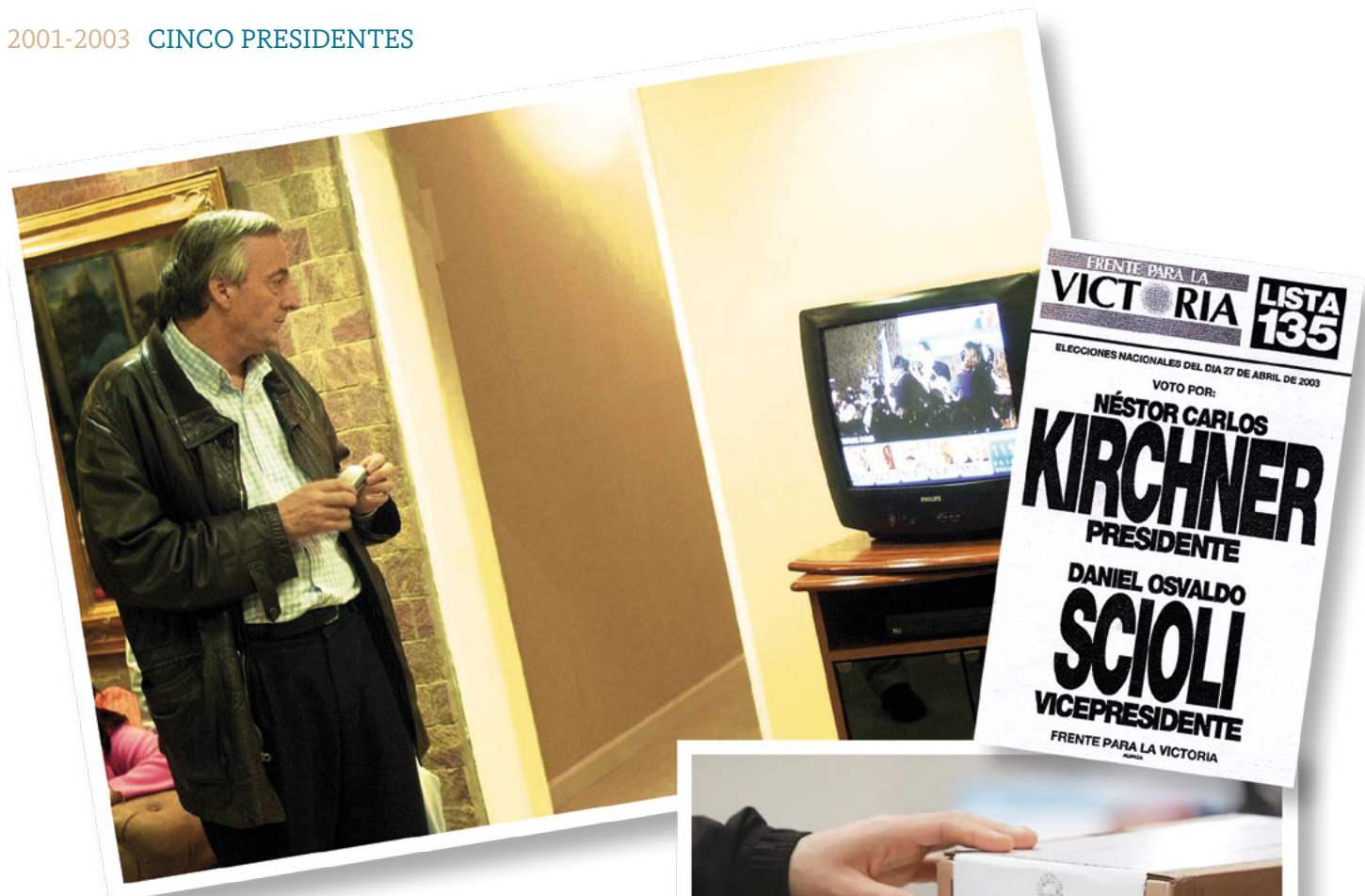
En medio del descreimiento popular, Carlos Menem y Néstor Kirchner llegaron al balotaje, que nunca se realizó porque finalmente el riojano declinó su candidatura.