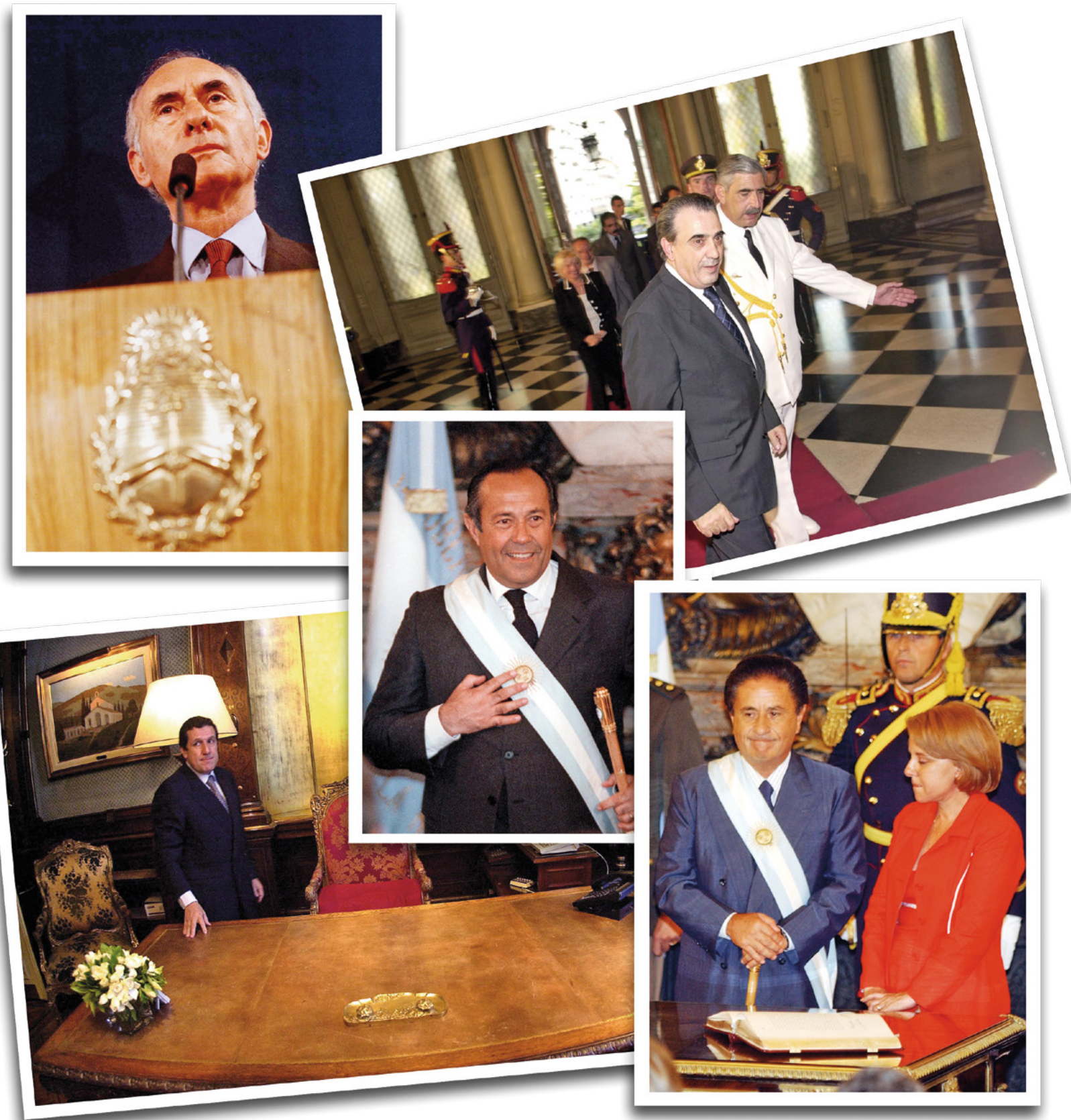
La crisis fue tan tremenda que en apenas once días la Argentina tuvo cinco presidentes: Fernando de la Rúa, Ramón Puerta, Adolfo Rodríguez Saá, Eduardo Camaño y Eduardo Duhalde.

La pesificación de los depósitos en dólares (1 dólar = 1,40 pesos) fue inmediata y los ahorristas pasaron a ocupar las primeras planas de los diarios denunciando su perjuicio. “Van a ser respetadas las monedas en